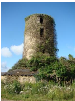
Moulin de Perny