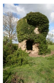
Moulin de La Regaudais