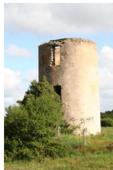
Moulin de Brangolo