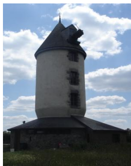
Moulin des Fresches

Nous pouvons citer quelques moulins : Moulin à eau de La Roche-Hervé ; « Le Moulin à Biron » à la Béchetais » ; « Le Moulin à Belet » à La Houssais ; « Le Moulin à Sérot » à La Regaudais ; « Le Moulin de la Tiolais » ; « Les Moulins de Coulement » ; « Le Moulin des Fresches ou de la Bézirais » ; « Le Moulin du Tjenia ou du Guignâ » ; « Le Moulin de Perny » Sans oublier La Minoterie de Ste Luce qui fut en activité de 1921 à 1975 (voir plaquette sur les Moulins – 2010)